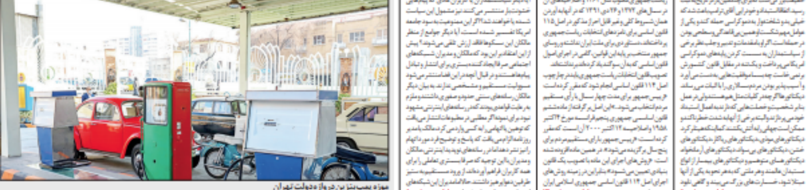
موزه پسر بزرگ در روز ویدوار تهران