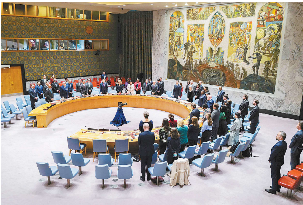
17日，美国纽约联合国总部举行的安理会会议开始时，全体代表默哀一分钟，向所有在加沙因公殉职的人道主义工作者致敬。

联合国大会作出决定。由于接纳新会员国为实质性议题，安理会的决定需要至少9个安理会成员同意且未遭常任理事国否决。联大表决则需要会员国2/3多数同意。法新社称，目前联合国193个成员国中，已有137个国家承认巴勒斯坦国。