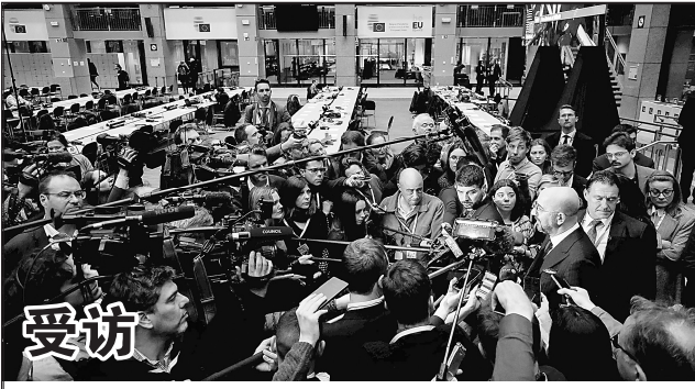
当地时间 18 日，欧盟峰会在比利时布鲁塞尔召开。欧洲领导人在峰会上讨论的重点包括美国和中国日益激烈的竞争、如何提升欧盟竞争力、中东的紧张局势以及俄乌冲突。图为欧洲理事会主席米歇尔在会后接受记者采访。

据美国 Axios 新闻网报道，以色列战时内阁曾在 15 日的会议上考虑批准以色列国防军对伊朗展开报复。报道援引两名以色列官员的话说，当天晚些时