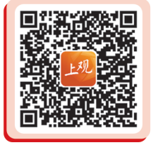
建言 投稿 爆料 求助 扫码参与互动