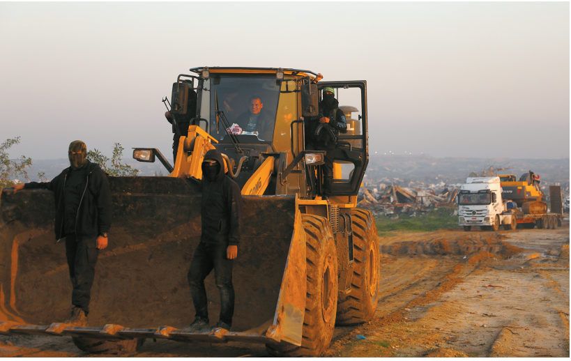
1月7日,在加沙城东南部的宰通社区,哈马斯成员参与对加沙地带最后一具以色列被扣押人员遗体的搜寻工作。

由埃及同哈马斯、巴勒斯坦民族解放运动(法塔赫)共同确定,成员名单已发给美国和以色列确认。