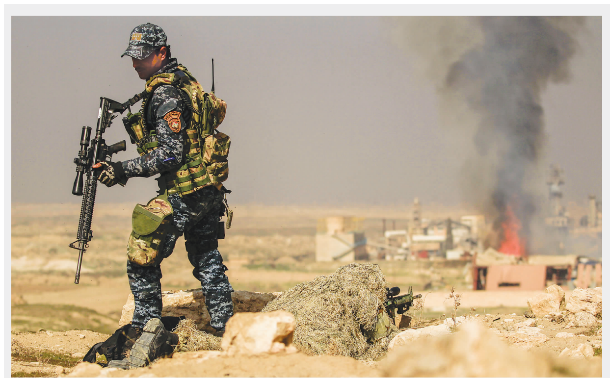
2 月 23 日,在伊拉克摩苏尔,政府军士兵参加攻打摩苏尔机场行动。

摩苏尔是伊拉克工业、农业和能源重镇,战略位置重要,可谓直接关系到“伊斯兰国”在伊拉克的经济和战略命脉。伊拉克政治分析人士易卜拉欣·阿梅里认为,失去摩苏尔对“伊斯兰国”来说是“国将不国”的重大失败,因此收复费卢杰达宣布“立国”之地的