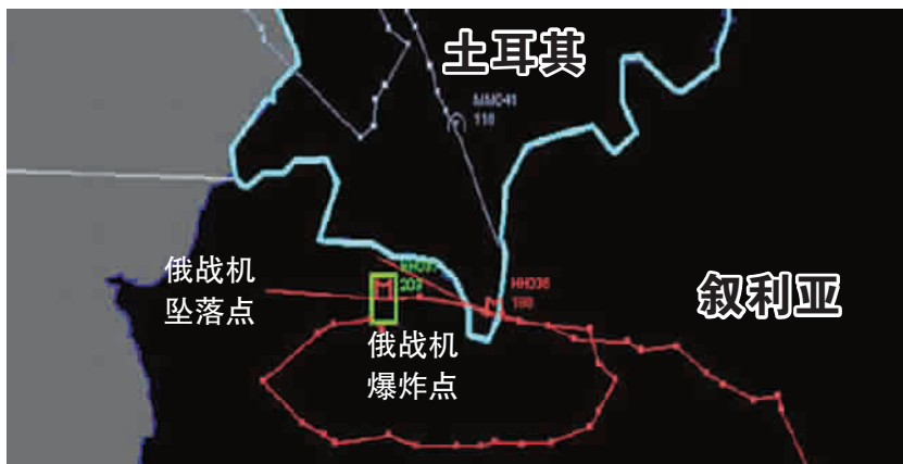
■ 俄方公布的战机路线图显示俄战机(红)未曾进入土领空,蓝线为土战机路径,过土领空 ▲ 土耳其官方公布的路线图显示俄战机曾越